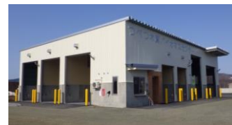
つべつ木質バイオマスセンター（見学先②）