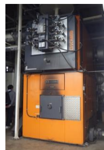
シュミット社製 高湿潤チップボイラー