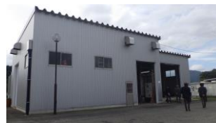
ボイラー棟（3棟のうち1棟）（チップサイロ含む）