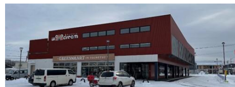
津別町大通地区コミュニティ施設「ウッドルーム」の外観（見学先①）