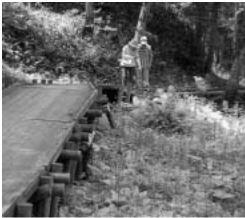
クリンソウの花が迎えてくれる散策路