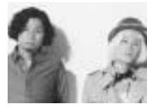
吉田山田 HBCラジオ 「吉田山田の道産子よ、ラジオを抱け!!!」毎週日曜日24:30放送中