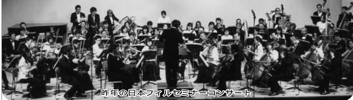
昨年の日本フィルセミナーコンサート