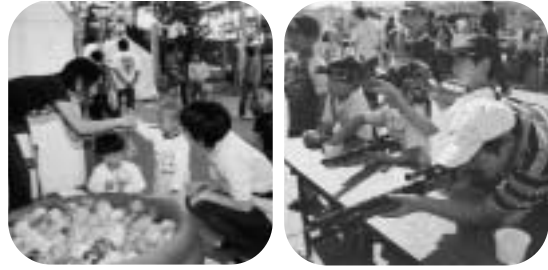
昨年のつべつふるさとまつり