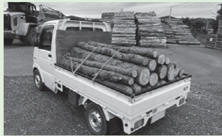
つべつウッドロスマルシェの様子

次回開催日につきましては来年の5月を予定していますが、開催日以外の買い取りも随時受け付けていますので、下記までお気軽にお問い合わせください。